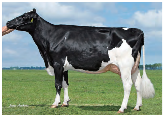
母の母: シヤイン P