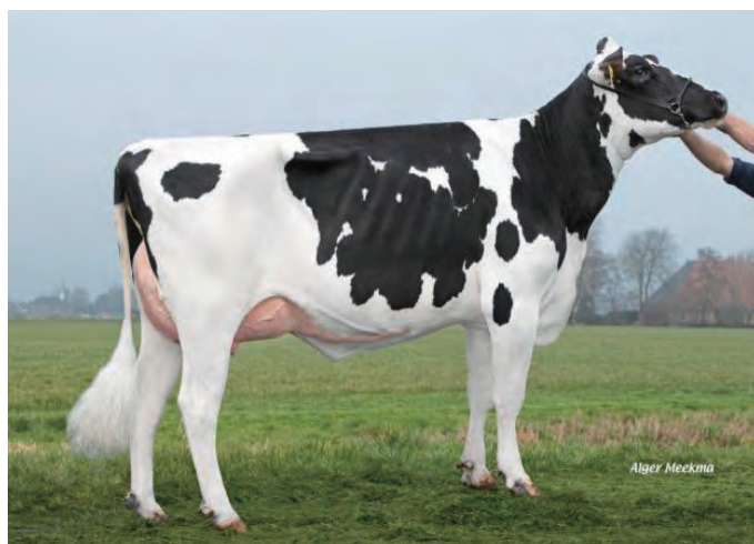
母の母: ジョーキエ