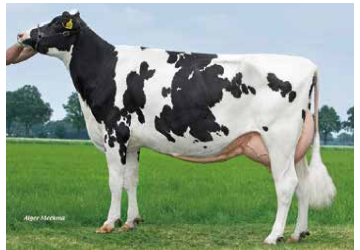
母の母:224 ピールデイーカー リエジー 1224