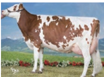
セラファームリハナー (全姉妹)